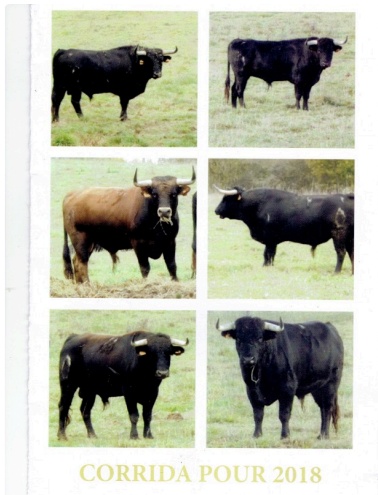
Les toros pour 2018