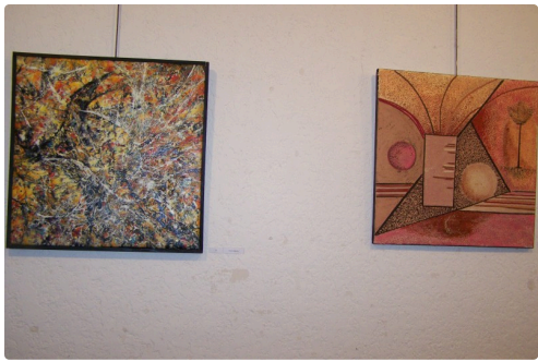
expo formats carrés à l'ot de samatan 2018 004.JPG