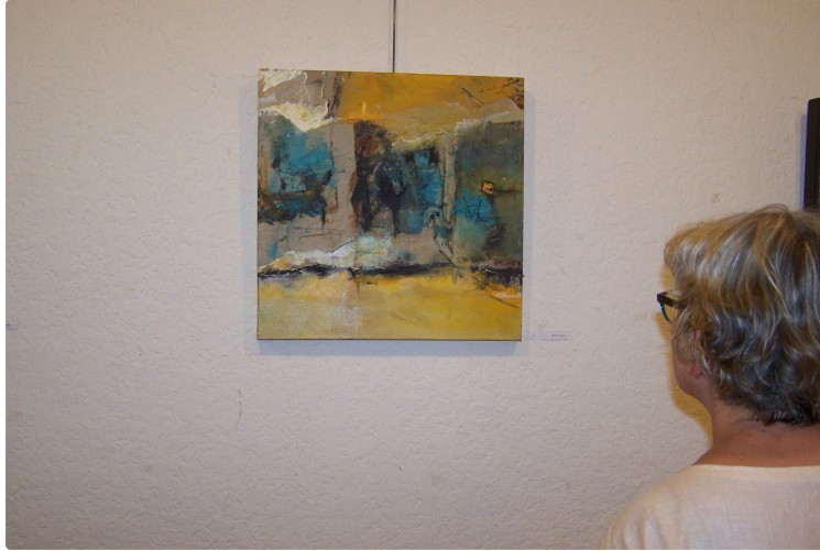
Nouvelle idée "captivante" pour une exposition à l'Office de tourisme du Savès

Photo : Un format respecté par les artistes exposants