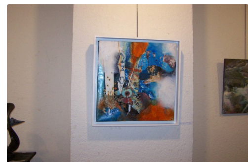
expo formats carrés à l'ot de samatan 2018 005.JPG