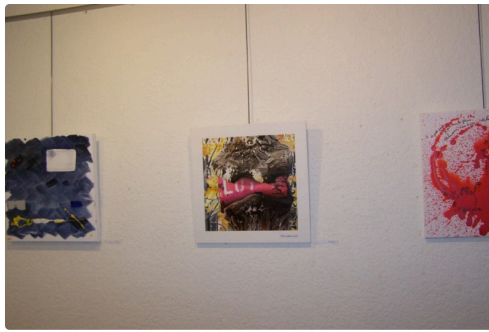
expo formats carrés à l'ot de samatan 2018 003.JPG