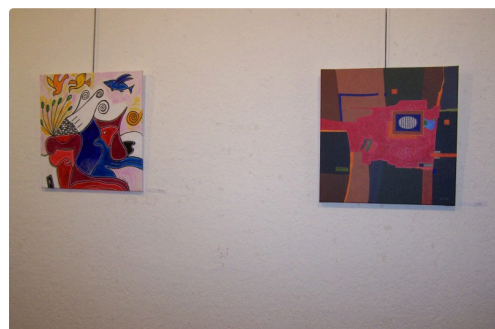
Quelques photos de certaines œuvres