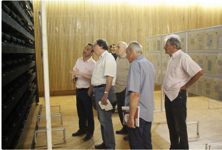
Inauguration de l'exposition philatélique.

3000 lettres retraçant 350 ans d'histoire postale d'Auch.