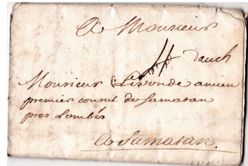
Lettre datée 1740.