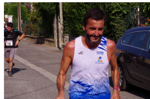
10kms mirande 2018 5.JPG