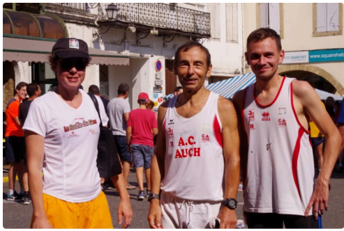
10kms mirande 2018 7.JPG