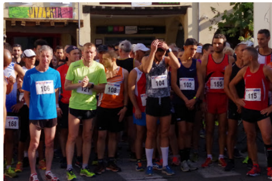
cittaslow mais on y court vite

Les 10kms de Mirande se disputaient dimanche matin