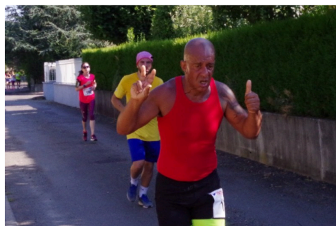
10kms mirande 2018 6.JPG