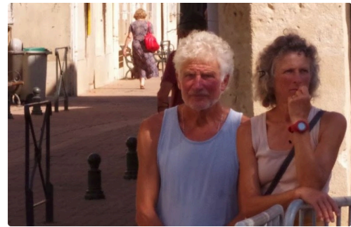
10kms mirande 2018 10.JPG