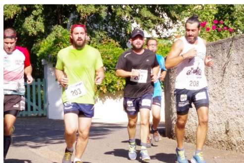
10kms mirande 2018 4.JPG