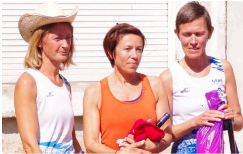
10kms mirande 2018 11.JPG