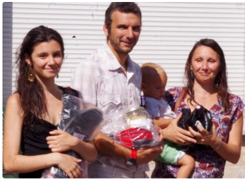
10kms mirande 2018 9.JPG