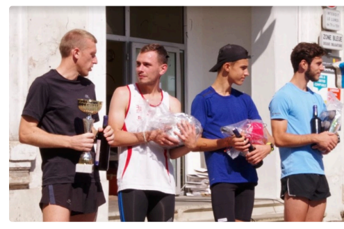
10kms mirande 2018 8.JPG