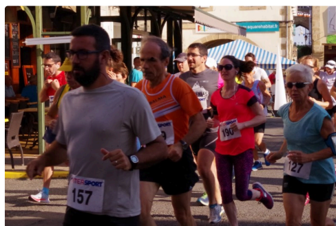
10kms mirande 2018 2.JPG