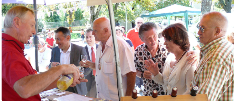
Foire aux vins et eaux de vie gersois : Un succès populaire qui ne se dément pas avec plus de 1 500 visiteurs

Samedi 11 août en matinée sous un soleil radieux, la 34e foire aux vins et eaux-de-vie gersois a ouvert ses portes à cet évènement incontournable dont le but est de présenter le savoir faire des vigneron gersois. Ils étaient une trentaine d'exposants prêts à recevoir les officiels emmenés par le parrain de la foire, André Daguin, et d'accueillir plus de 1 500 visiteurs.