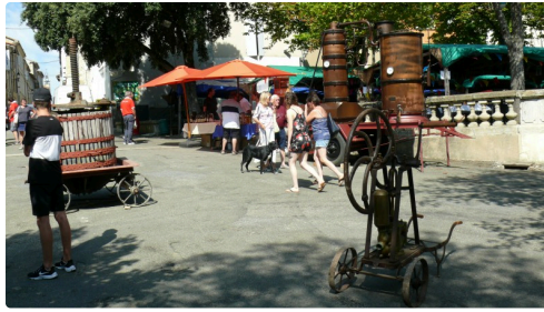
Des pièces de collection.