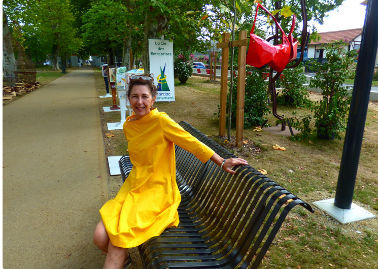
Les promenades à l'heure du Festival