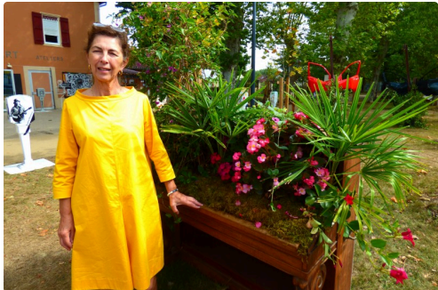
le piano avec les fleurs des jardins de Blandy