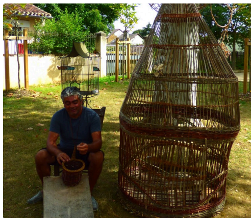
la cage aux oiseaux de Louis

Une exposition d'un ensemble plein d'intérêt.