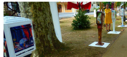
les boîtes à lettre