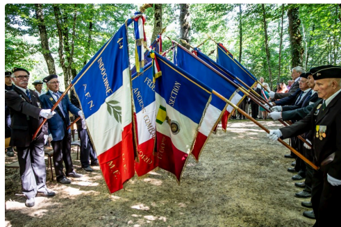
Les drapeaux s'inclinent devant la stèle