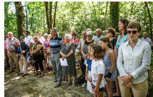
La chorale chante la Marseillaise et le Chant des Partisans, puis une fanfare d'anciens joue une sonnerie aux morts exemplaire