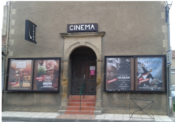
Ciné et pet' dej'

Dimanche 12 Août - 10h30 - Ciné p'tit dej avec au programme Les Indestructibles 2 - Petit-déjeuner offert par le cinéma à 10h, projection à 10h30 -