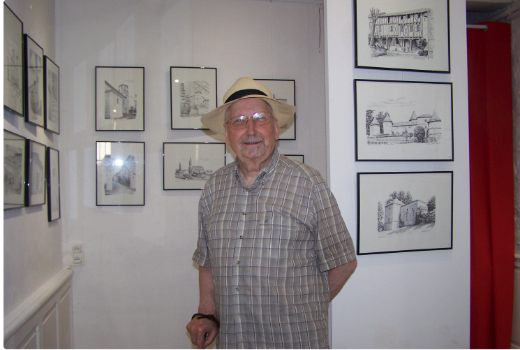
Un jeu d'ombre et de lumière : beauté et élégance des dessins à l'encre de Bernard Comte

Photo : Bernard Comte devant ses oeuvres