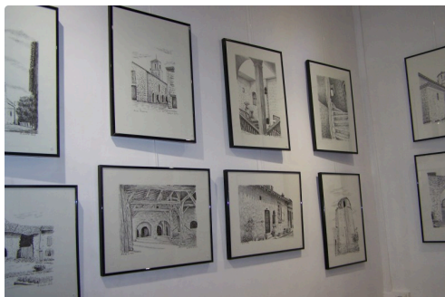
Il a sillonné le Gers à la rencontre de son patrimoine exceptionnel et dessine avec "art" des sites inconnus remarquables...