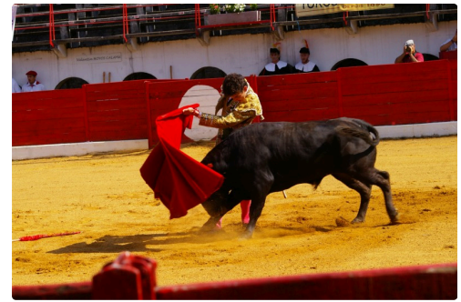
Main gauche en core avant les bousculades