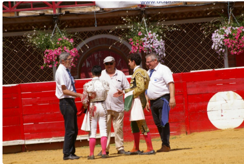
Les récompenses à l'issue de la novillada