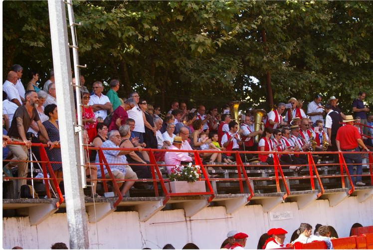
Novillada non piquée de Riscle samedi matin

Deux oreilles , il aurait pu y en avoir quatre