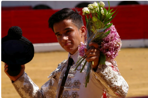
Nino fleuri lors de la vuelta