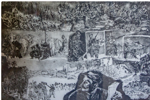
La guerre de 14