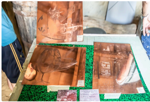
Pierre Raynal présente des plaques gravées