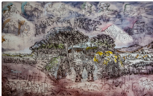
La guerre traverse la campagne (œuvre la plus récente)