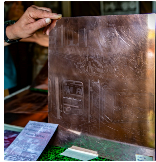
Une plaque de cuivre