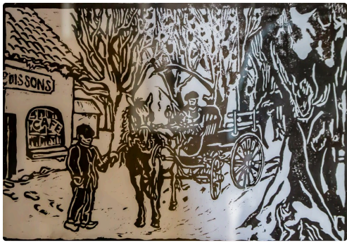
Gravure sur bois