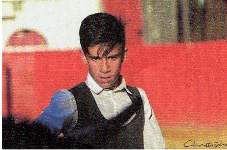
Feria de Riscle

Tendido risclois : DEUX NOVILLADAS AUTHENTIQUES avec les Ganadérias Bonnet et Cuilllé.