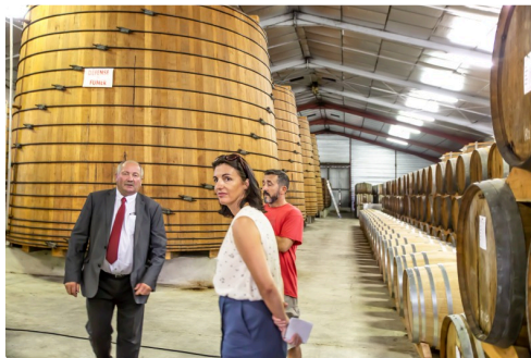
Le chai d'armagnac