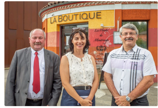
La visite des installations va commencer