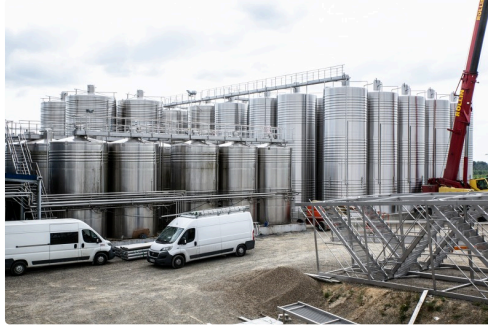
On la voit sur la droite de la photo