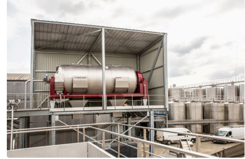
Le nouveau presseur vient renforcer les deux autres déjà en place