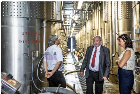
Dans le chai de vinification