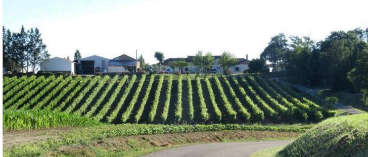
Mercredi 1er août marché à la ferme aux 3 Domaines

La soirée débutera à 16 heures par la visite de la cave et dégustations