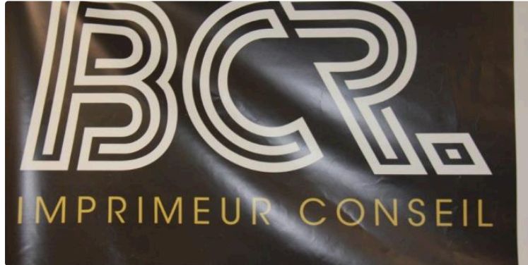
Labellisée Imprim'Vert et certifié PEFC, l'imprimerie BCR poursuit son développement