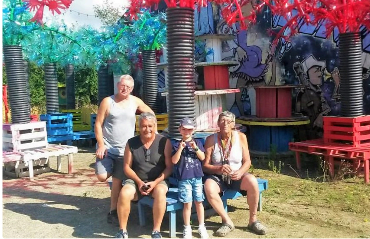
Dans les coulisses de Tempo Latino

Dans quelques jours, Vic-Fezensac ouvrira les portes de son 25ème festival Tempo Latino, et tout sera alors en place pour accueillir artistes et festivaliers.