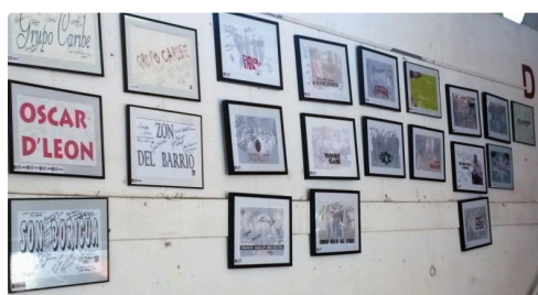
Et signature des artistes célèbres qui ont fait la renommée de Tempo Latino