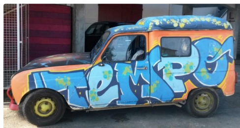
On affiche des couleurs très Tempo