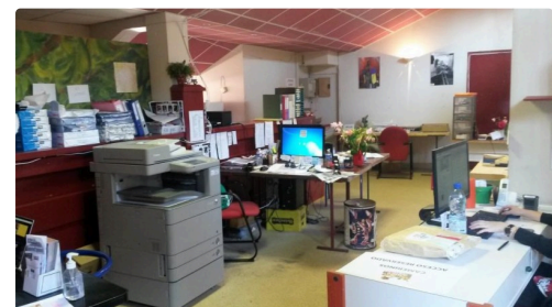
Les bureaux aux arènes, le temps du festival