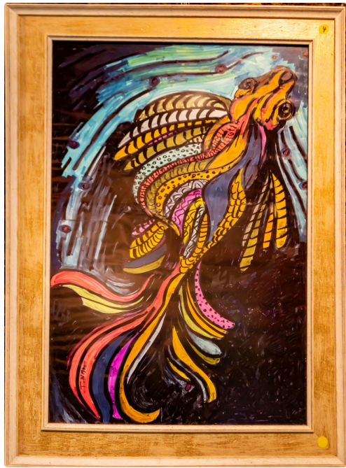
Un poisson multicolore