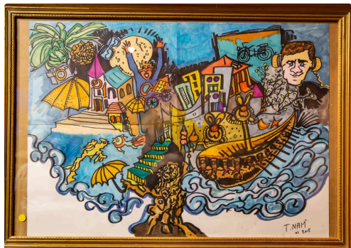
Un monde complexe