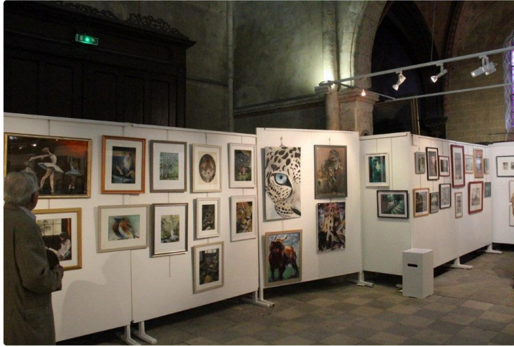
Les expositions s'enchaînent à l'Espace Saint Michel.