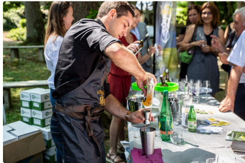
Confection d'un cocktail à la blanche d'armagnac