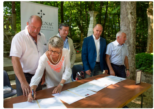
Signature de la convention de partenariat Pays d'Armagnac - filières