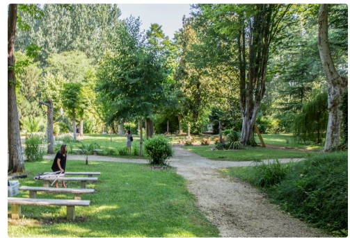
Autre vue du jardin