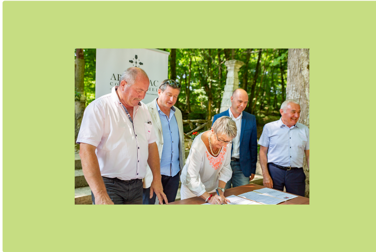
L'oenotourisme prend corps dans le Pays d'Armagnac

De l'armagnac, du floc, du vin, des chapelles et des domaines