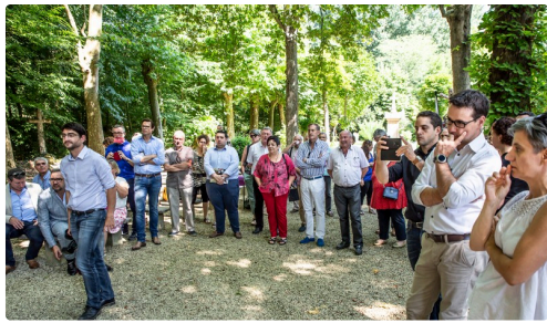
L'assistance (élus, représentants des filières partenaires et des offices de tourisme)