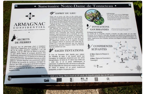
Panneau sur pupitre devant la chapelle du Tonneteau