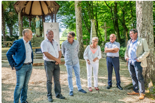
Panneau sur pupitre devant la chapelle du Tonneteau