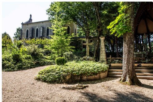
La chapelle du Tonneteau et le jardin en contrebas