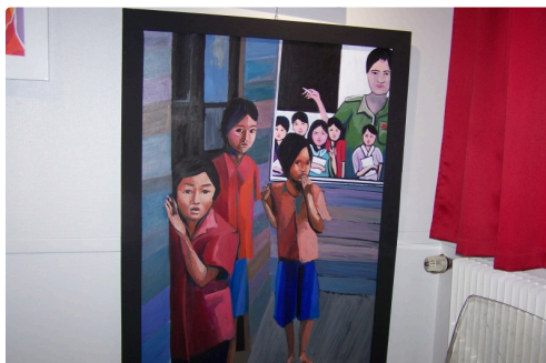
expo office de tourisme et vélo station l'isle jourdain 2018 005.JPG