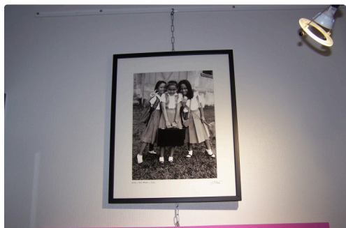
expo office de tourisme et vélo station l'isle jourdain 2018 007.JPG