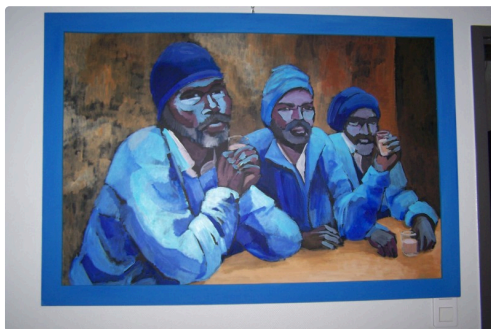
expo office de tourisme et vélo station l'isle jourdain 2018 008.JPG