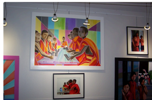
expo office de tourisme et vélo station l'isle jourdain 2018 004.JPG