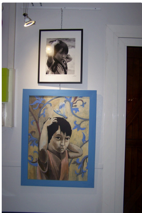
expo office de tourisme et vélo station l'isle jourdain 2018 002.JPG