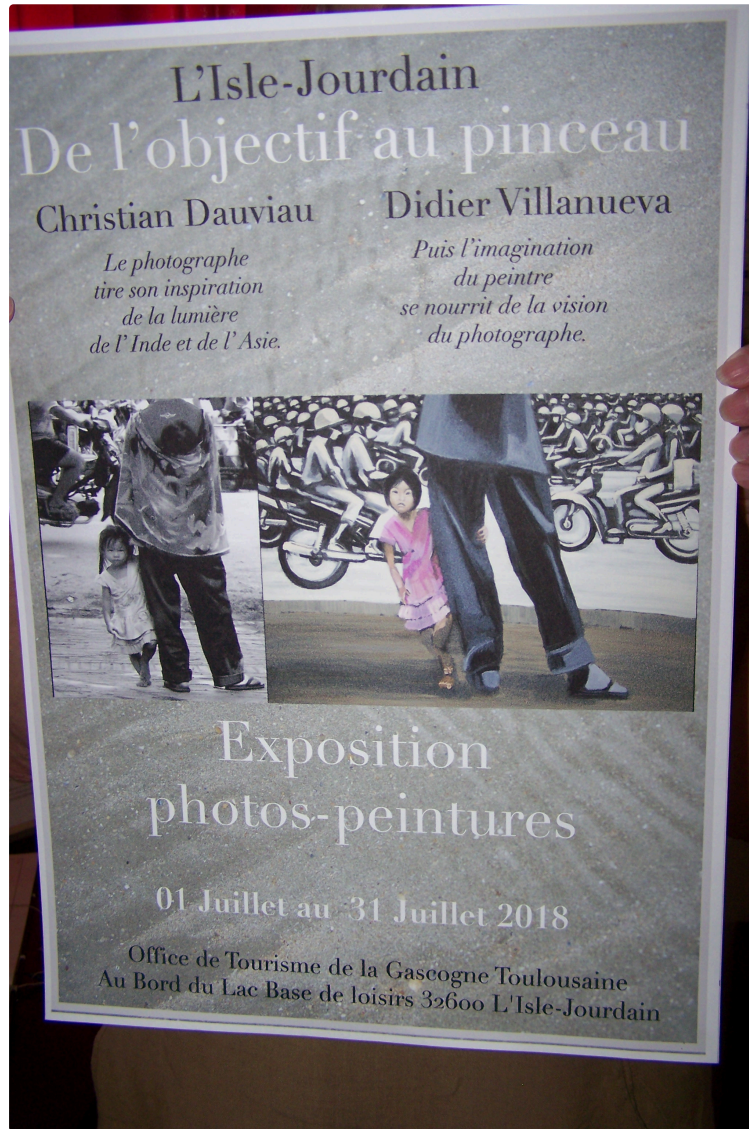
Des oeuvres artistiques par deux regards d'artistes, l'un photographe et l'autre peintre à l'Office de Tourisme de la Gascogne Toulousaine