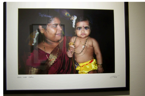
expo office de tourisme et vélo station l'isle jourdain 2018 012.JPG