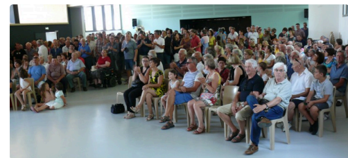
Le public à l'écoute des discours.