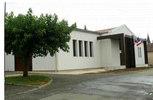
Le Foyer Rural après réhabilitation.