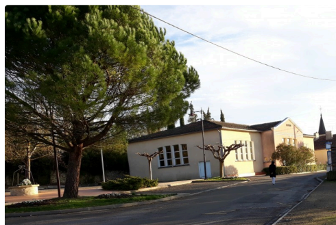
Le Foyer Rural avant réhabilitation.