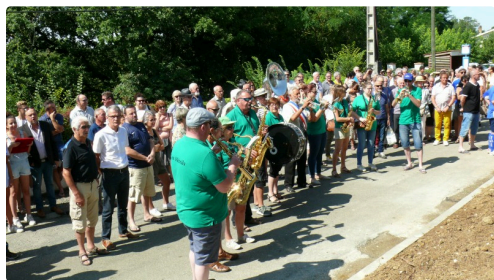
Ils ont joué la Marseillaise.

A l'issue de l'inauguration, la municipalité proposa un apéritif dinatoire qui fut fortement apprécié.