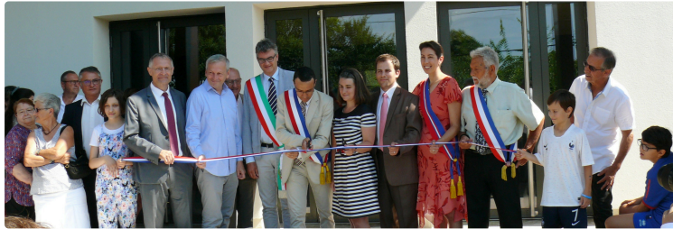
La nouvelle salle polyvalente inaugurée

Une réalisation réussie et fortement appréciée par les Elus départementaux et la population durannaise