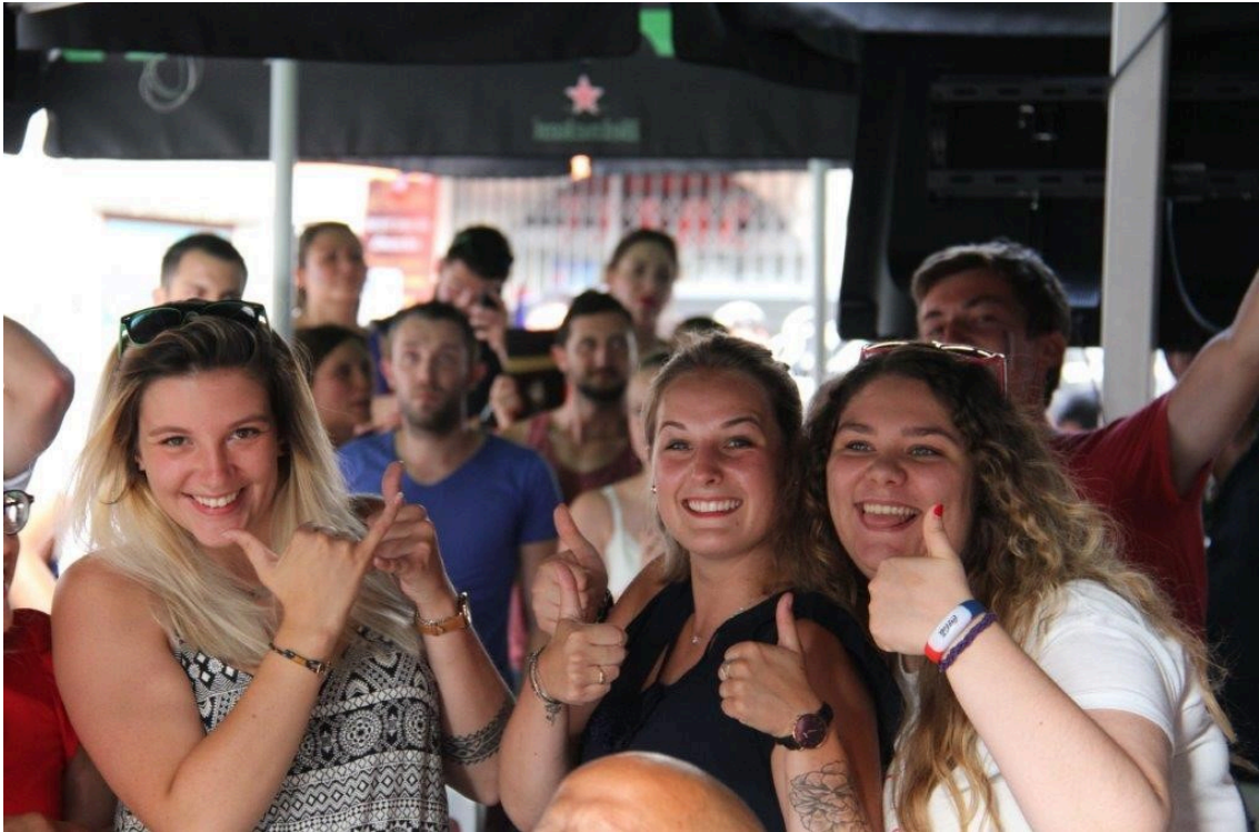
Bravo les Bleus !...