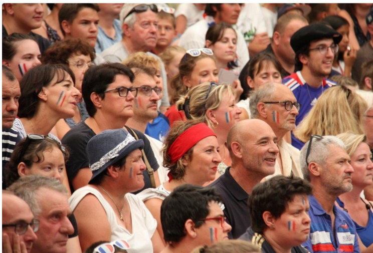
Ambiance torride dans la fan zone

L'ambiance était électrique hier dès le coup d'envoi de la finale de la Coupe du monde de football qui opposait la France à la Croatie.