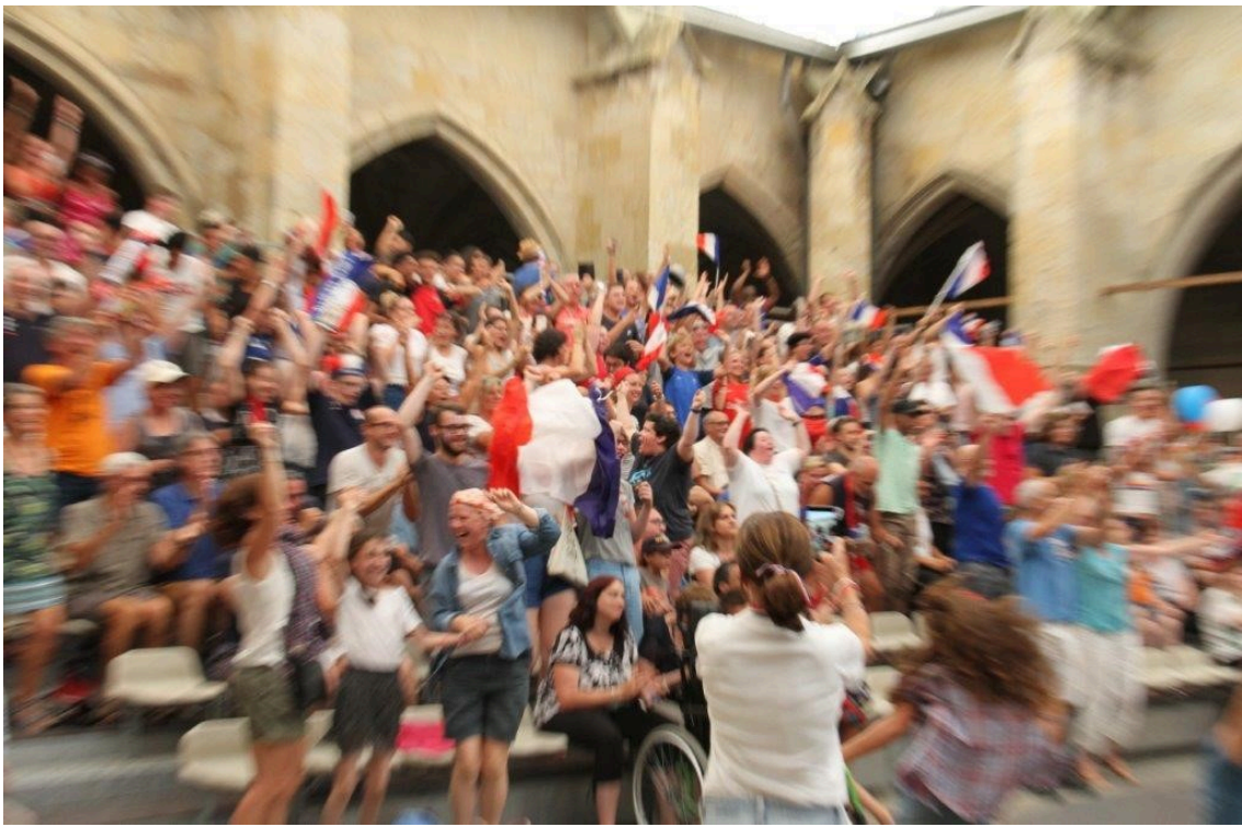
Libérés, délivrés !...