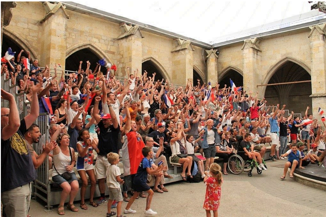
Bras en l'air, c'est tout bon !