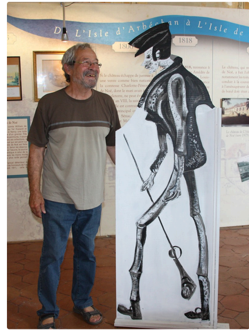
Cham vu par Dominique Bernier