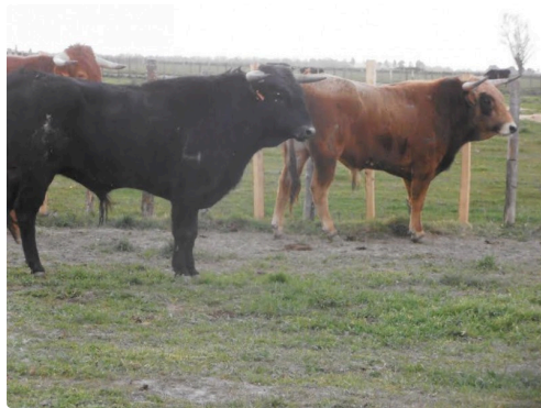
Les Sainte Cécile photo du haut Turkuay

Les dés sont jetés que les meilleurs gagnent