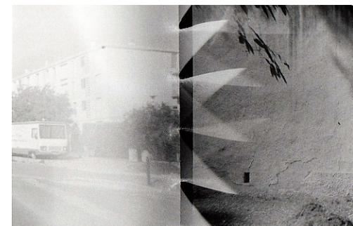
Bernard Plossu La Cité, 2005 Tirage argentique, 18 x 24 cm