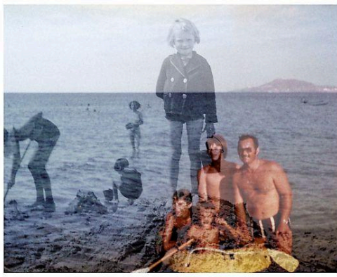
documentation collée d'après ACROZONS M, 2006 - 2009 Installation vidéo, vidéo en 3D