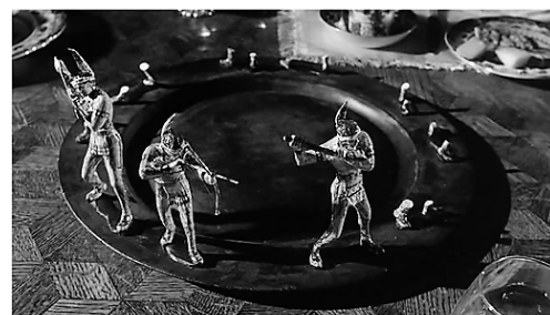
Laurent Fiévet Tou, 2018 Photogramme de Ten Little Indians de George Pollock, 1964

Photo de Une Régis Perray "Le mur des sols", depuis 1995. Photographie de l'installation Jürgen Spiler