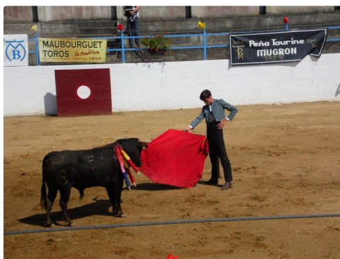
Solalito vainqueur à Castelnaud Rivière Basse