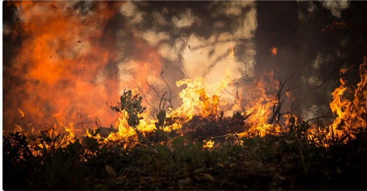
Feux de forêt : campagne de prévention

L'État lance une campagne estivale pour la prévention du risque incendie