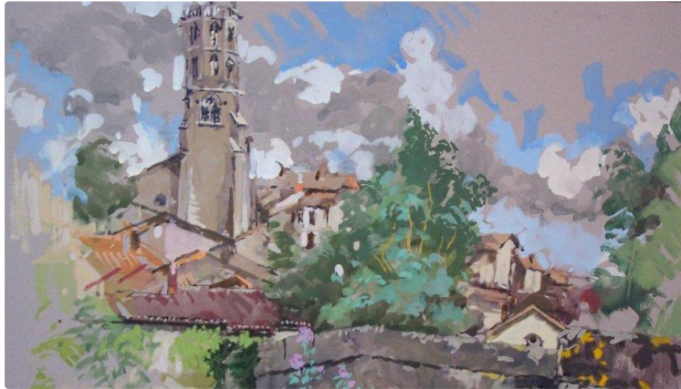
Les peintres de la Marine nationale exposent leurs vues sur le Gers