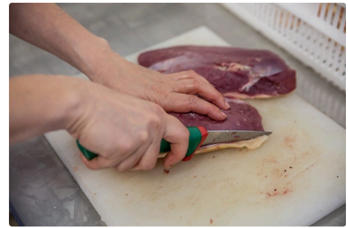
Parage des magrets