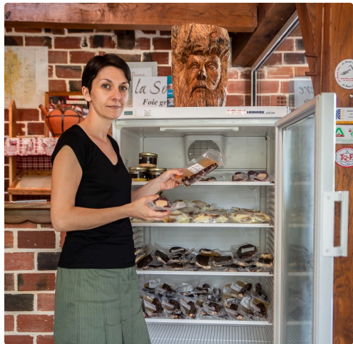
Les produits frais