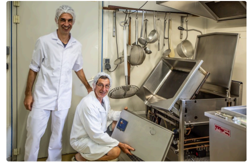
Devant une des machines (régulièrement entretenues)