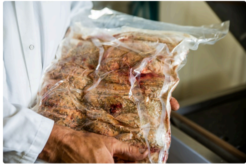
Un paquet de foies sous vide