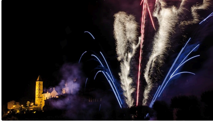
14 juillet à Auch.

Débutant par la cérémonie officielle le matin, la célébration du 14 juillet se poursuivra le soir sur le quai Lissagaray avec des danseuses brésiliennes, de la musique et un spectacle pyrosymphonique, créé spécialement pour la Ville d'Auch.