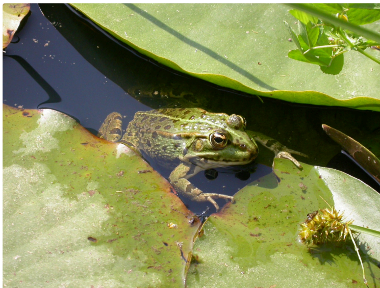
Eau et nature, les trésors du Gers

Pour son nouveau programme estival, le CPIE Pays Gersois propose aux petits et aux grands curieux de découvrir les trésors de l'eau et de la nature dans le Gers, à travers expositions photos, ateliers et balades pour toute la famille. Ces animations ont pour objectifs de :