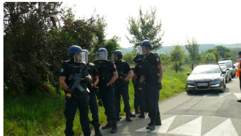
Arrivée du PSIG Sabre d'Auch.