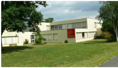
L'immeuble où étaient retranchés les terroristes.