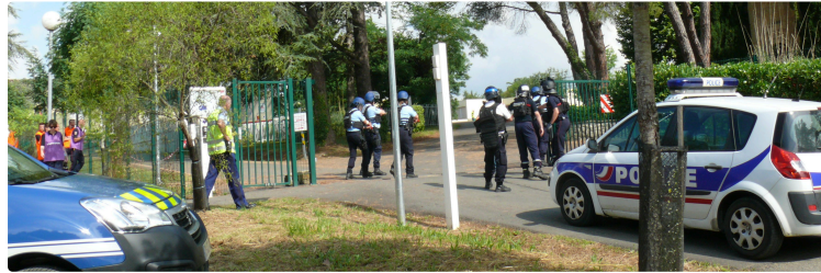
Une attaque terroriste simulée au lycée de Beaulieu

Il s'agissait de tester les capacités de coordination entre la police nationale et la gendarmerie