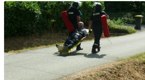
Évacuation d'un blessé.