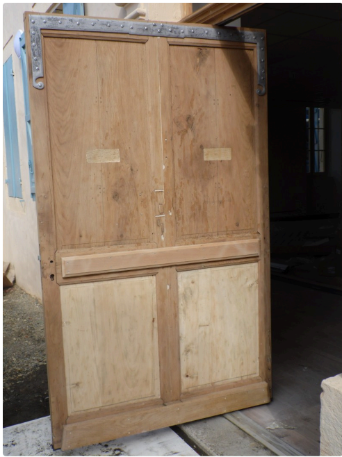
La porte d'entrée du bâtiment ancien était à deux battants, modifiée afin d'être aux normes de sécurité actuelles elle n'en compte plus qu'un