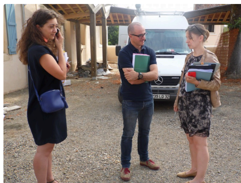
Les deux "maîtrises" ouvrage et oeuvre avec un artisan