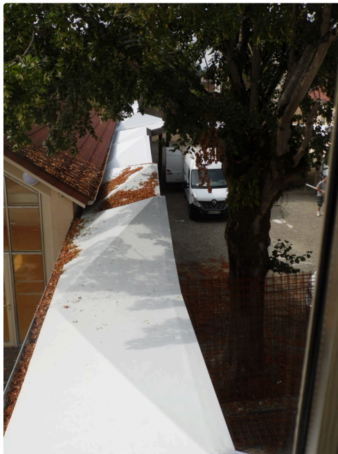
La coursive vue depuis l'étage permettra une circulation au sec par jours de pluie