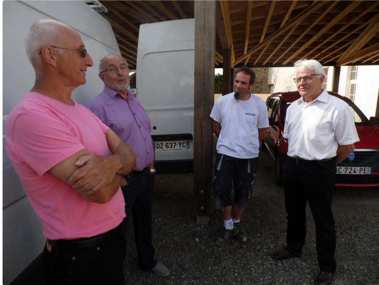
École élémentaire Olléris de Plaisance

La réception des travaux de réhabilitation avait lieu mardi matin