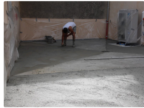
Mardi matin les finitions de la cour de la chaufferie avaient lieu