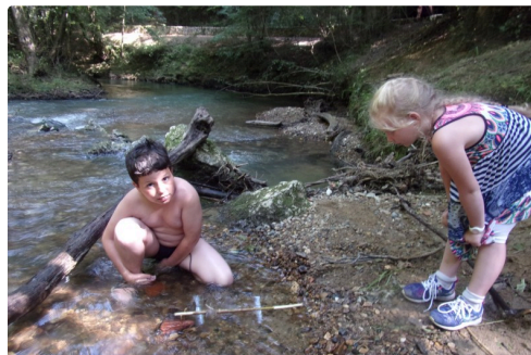
Premiers essais au moulin à eau !