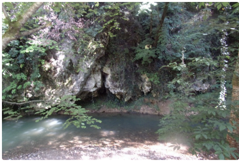
Les gorges de la Save