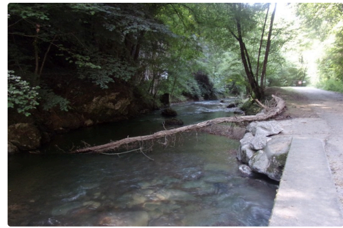
Les gorges de la Save