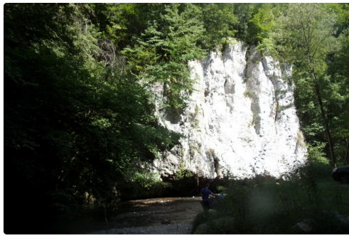
Les gorges de la Save