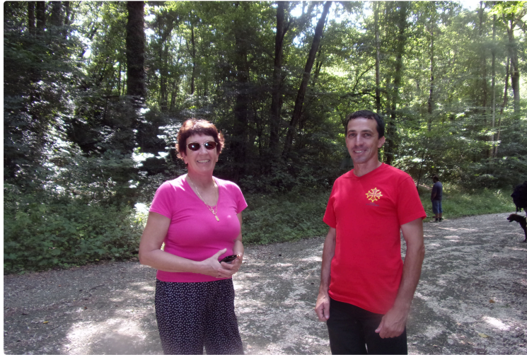
Joli succès pour "Lo Picnic" de Montmaurin !