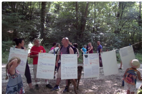
Les articles de presse depuis 2ans