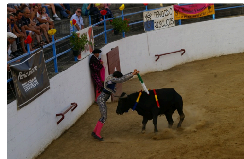
Solalito trois fois vainqueur samedi le matin de Lamothe , des ses deux opposants du soir en plus il bandeille bien