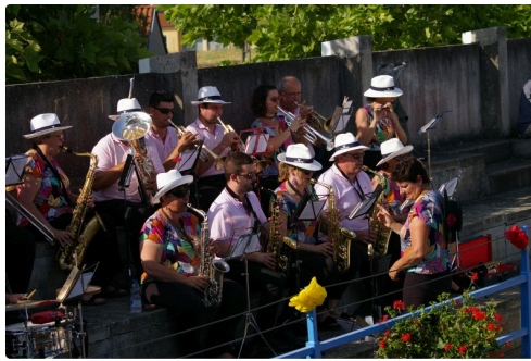
Al Violin anime avec toujours autant de qualité