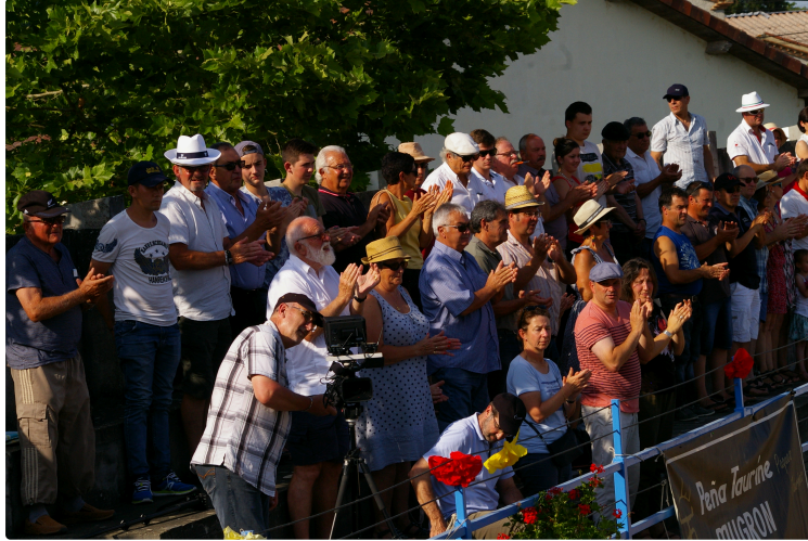
Dix huitième novillada concours à Castelnau-Rivière-Basse

Solalito et "Le Lartet" gagnants des trophées