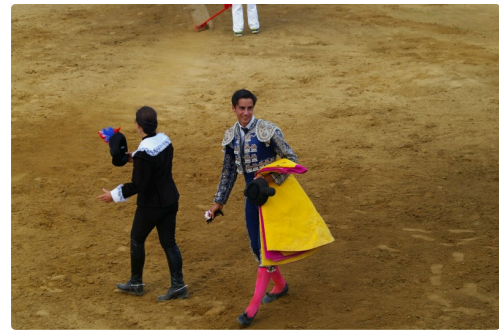
Solalito en fin d'après midi, ses deux oreilles lui donnent le prix du meilleur novillero 7 photos Marcel Lavedan