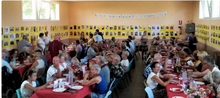
Les « Pierramides », fil de la vie locale

C'est en ce chaud dimanche 1er juillet que « Les Pierramides » ont vu le jour. Et il y avait du monde autour du berceau !