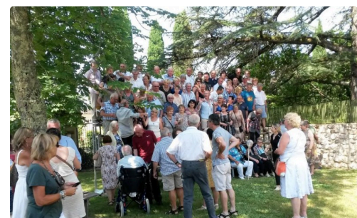
Tous en place pour la photo 2018