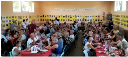
Un moment convivial qui marquera la vie de la commune