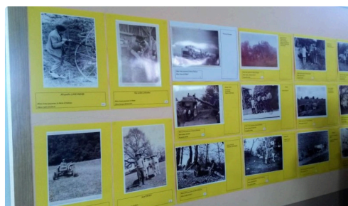
La vie d'antan en images