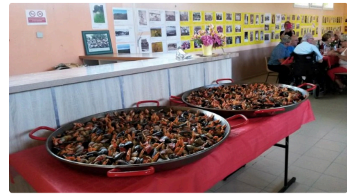
La paëlla géante sera très appréciée