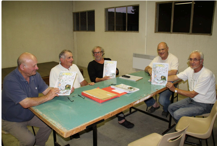
Miélán, Nouveau cercle d'histoire et d'archéologie.

La plaquette N°14 Miélán et les communes environnantes est parue.