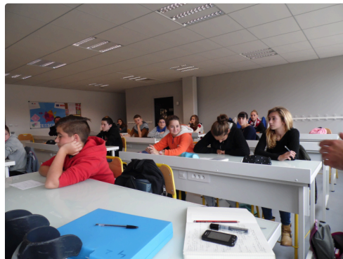
Des 4e émus par le récit et attentifs