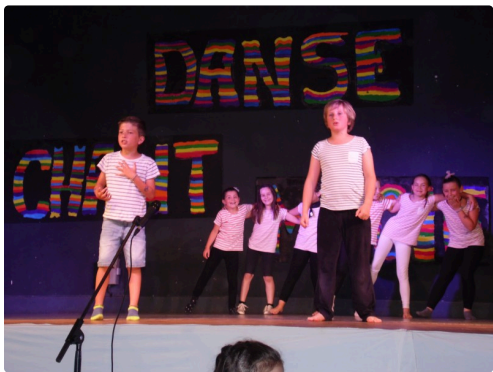
du 23 juin 2018