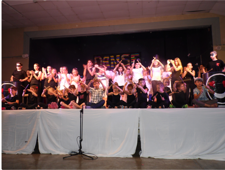
Spectacle de fin d'année du centre de loisirs

Superbe sublime dans le visuel émouvant dans le contenu