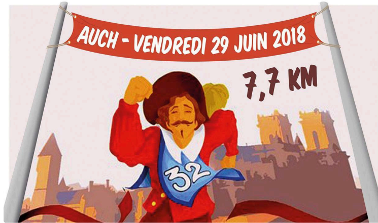
Sur les pas de d'Artagnan : Une prestigieuse course pédestre

Cette course aura lieu vendredi 29 juin en soirée dans les rues d'Auch où il n'est pas interdit de venir avec un déguisement