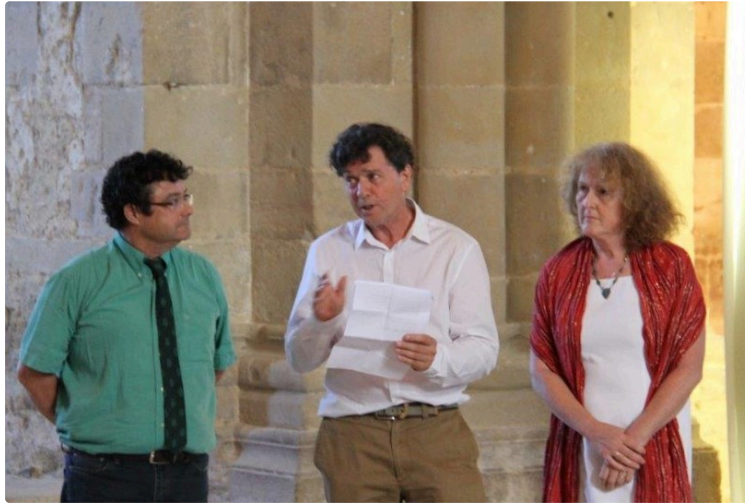
Art contemporain à l'abbaye de Flaran

La Conservation départementale du Patrimoine et des Musées du Gers poursuit le travail engagé autour de l'art contemporain, initié cette saison par la présence des œuvres de Barbara Schroeder dans les jardins ainsi que par une nouvelle exposition de peintures de l'artiste Paul Storey.