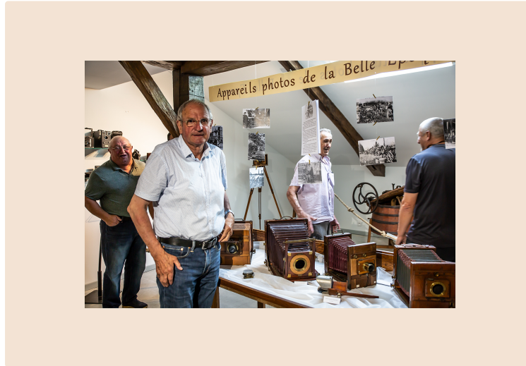
Des appareils photo anciens au Musée de Toujouse

En situation dans une salle de classe 1900