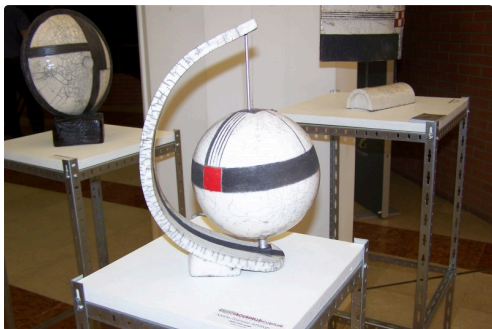
Festival sculpture montauban et 5 ans de la médiathèque st clar 006.JPG