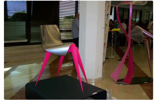
Festival sculpture montauban et 5 ans de la médiathèque st clar 004.JPG