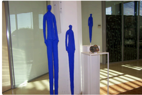
Sculptures de Béatrice Fernando ( Gers )