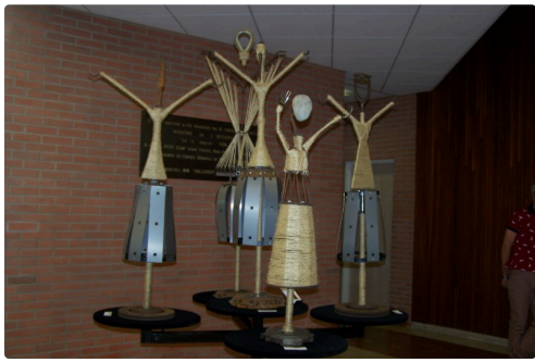
Festival sculpture montauban et 5 ans de la médiathèque st clar 029.JPG