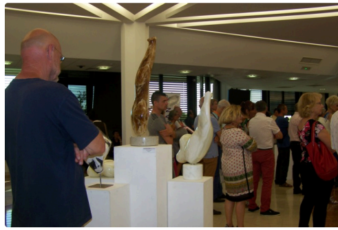
Festival sculpture montauban et 5 ans de la médiathèque st clar 030.JPG