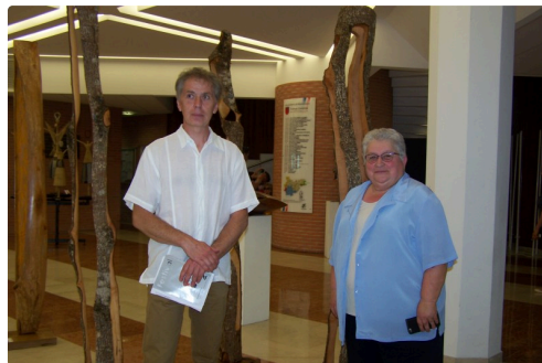
Les personnalités devant les totems en bois