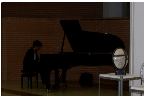
Instant musical, quelques morceaux de Chopin interprété par un élève de l'école de musique...