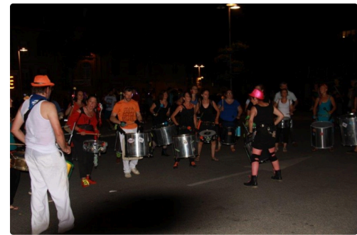
fin de nuit place Gambetta