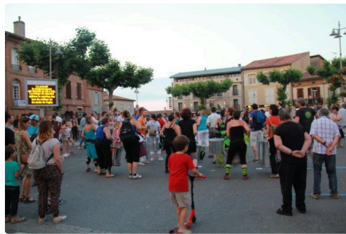
du monde place Gambetta