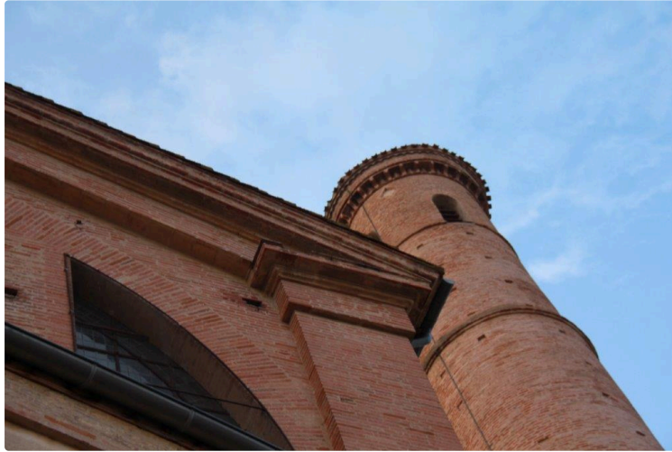
fête de la musique chez les lislois

La ville reprend vigueur et ses habitants se divertissent