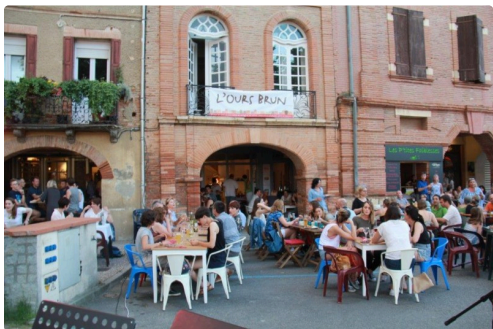
terrasses place Gambetta