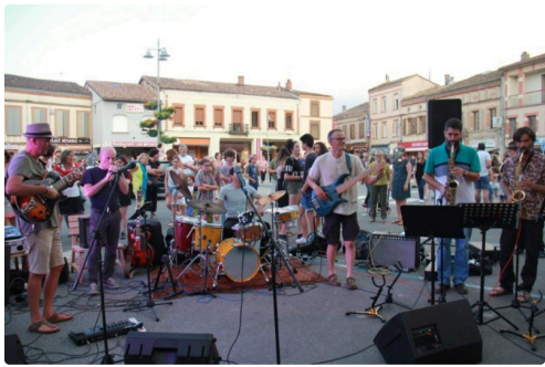
le finger jam