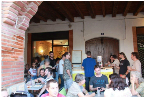
sous les arcades