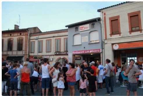
une belle foule

C'est tard dans la nuit que les Lislois sont rentrés chez eux, venus à grand nombre (entre 3 et 3500 personnes), pourtant en milieu de semaine, mais avec la satisfaction d'avoir pu assister à un bon moment de distractions en tous genres.