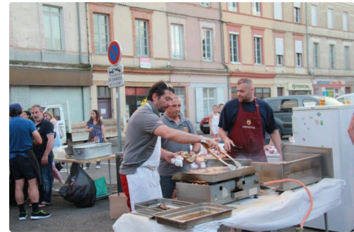
restauration chez les Pepinots