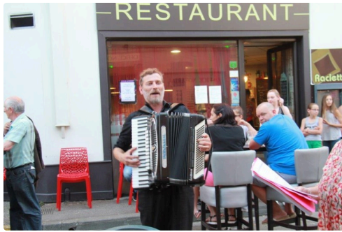
l'accordéoniste de la chorale aux chants italiens