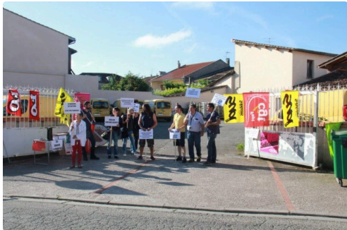
les manifestants vicois devant la cour du tri lisois