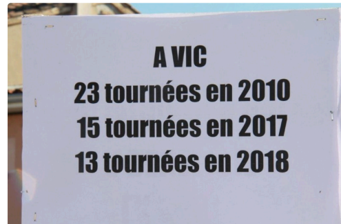
panonceau pour ce qui arrive à Vic