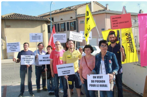
manifestation des Vicois en colère