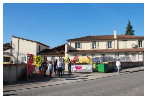
effervescence ce matin à la Poste de L'Isle-Jourdain

Ce mardi 19 juin 2018 la poursuite de la grève des facteurs de Vic-Fezensac a été votée à l'unanimité, après 22 jours de grève.