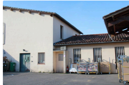
les services du tri lisois