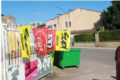
les organisations représentatives