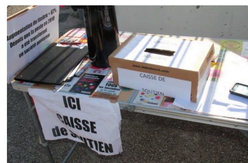
la caisse de solidarité