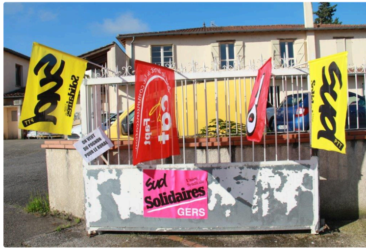
Rencontre des militants vicois avec les postiers lislois

Des précisions sur les raisons de la grève