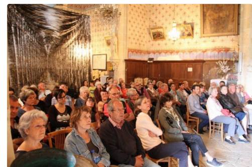
Le public à l'écoute de l'orgue.