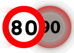
C'est désormais officiel la limitation de vitesse à 80kms/h s'appliquera le 1er juillet

le décret d'application publié au JO dans la nuit de samedi à dimanche.