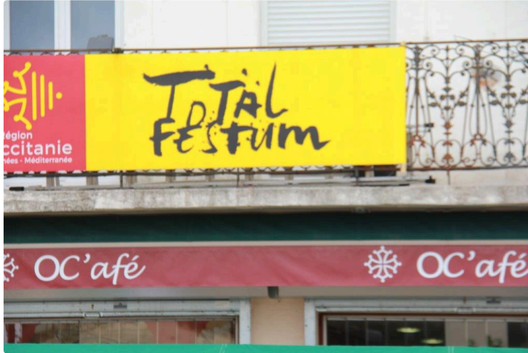
la manille au Oc'afé

Ce samedi 16 après midi Vincent Rivière , d'Escota è Minja, avait investi le café des 4 chemins pour y installer des tables de jeu de manille dans les deux langues.