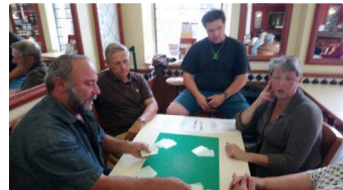
l'enseignement à ceux ou celles qui ne connaissent pas la manille