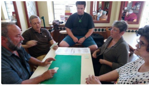
précisions du professeur