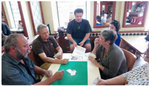
prêts à jouer