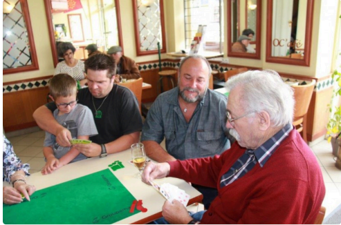
même les enfants s'intéressent