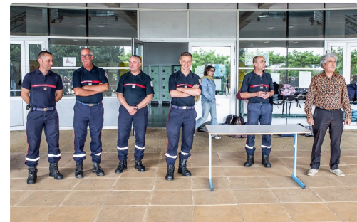
Les cadres sapeurs-pompiers et le principal face aux collégiens