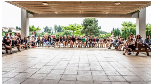
Les collégiens sont rassemblés pour la cérémonie