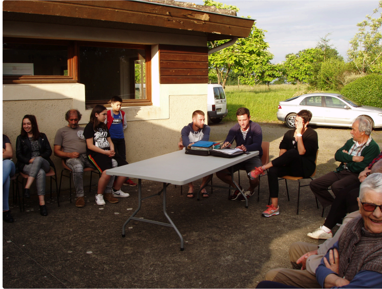
Assemblée .Générale du comité des fêtes de Galiac

Elle avait lieu jeudi soir autour du foyer rural